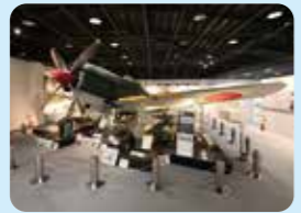
知覧 特攻平和会館

太平洋戦争の沖縄戦において、特攻という人類史上類例のない作戦で、爆弾搭載の飛行機もとも敵艦に体当たり攻撃をした陸軍特別攻撃隊員の遺品や関係資料を展示しています。