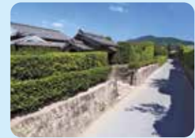
知覧 武家屋敷庭園

麓一帯を庭園化した美しい町並みで、古来より「薩摩の小京都」とたたえられている。昭和56年に国の「重要伝統的建造物群保存地区」に選定され、7庭園は国の「名勝」に指定されています。