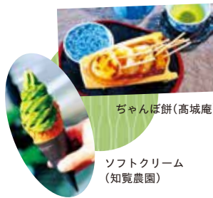
ちゃんぼ餅(高城庵)