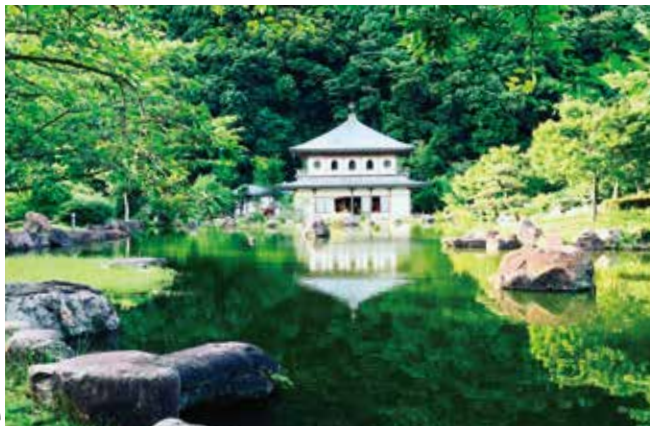
公園のシンボルの存在、池畔に建つ和風建築