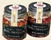
オリーブオイルコンフィ