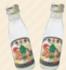
指宿温泉サイダー