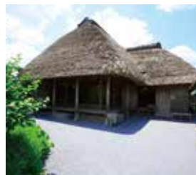
知覧独特の建築文化で作られた知覧型二ツ家。