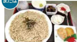
または 無農薬、添加物不使用のざるそば定食 (天ぷら・刺身付き) ※温かいそばも可