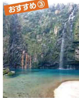
大河ドラマで話題の 「雄川の滝」