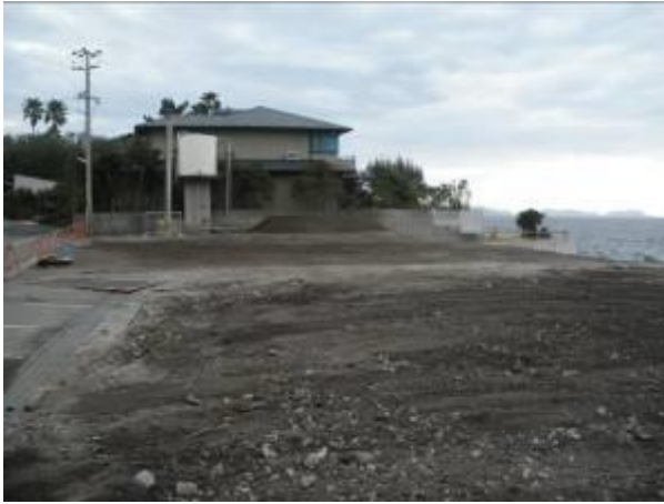
< ① >