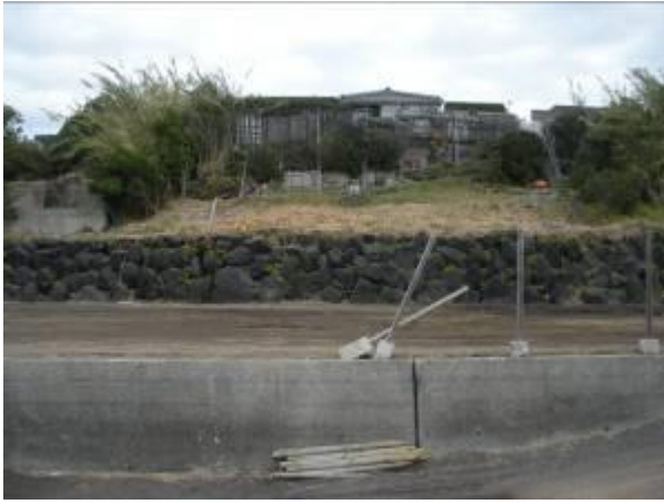
< 9 >