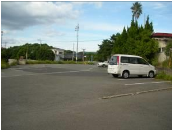
< 13 >