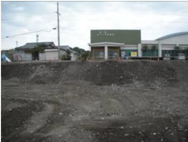
< ⑤ >