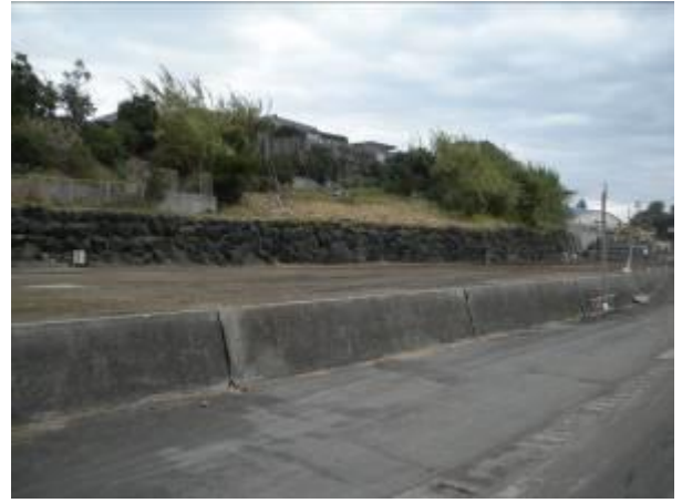
< 10 >