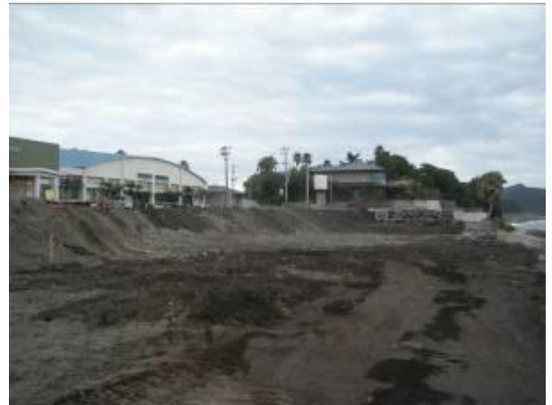
< ⑥ >