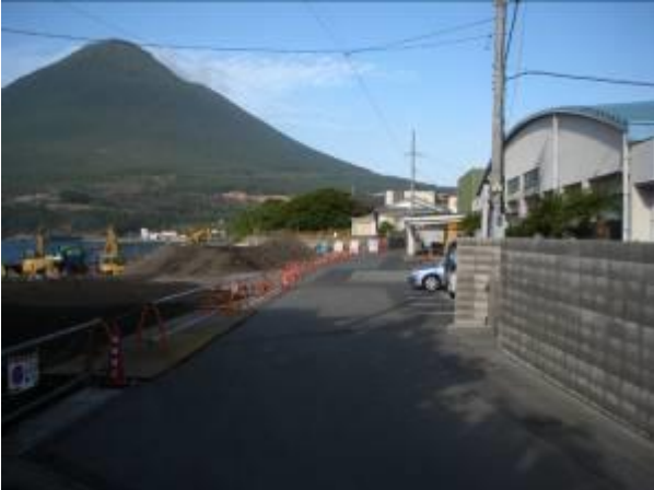
< 15 >