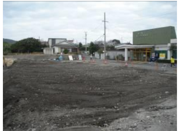
< ④ >