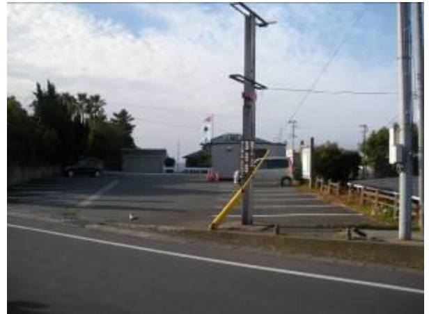
< 14 >