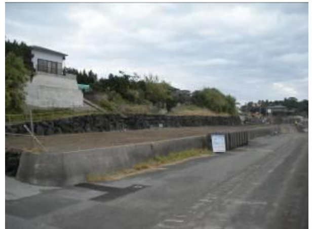
< 12 >