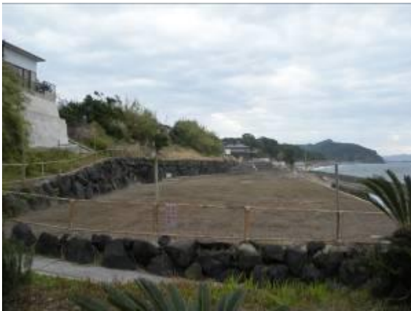
< 11 >