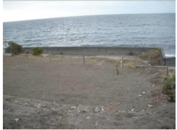
< ② >