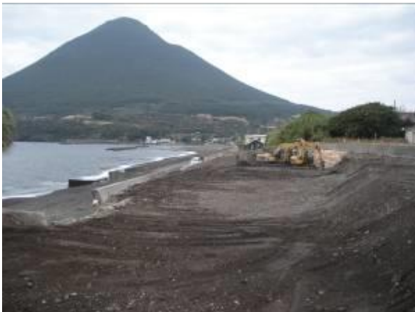
< ⑦ >