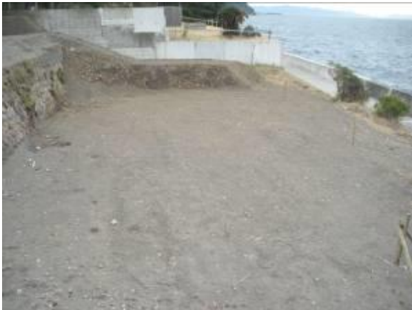
< ③ >